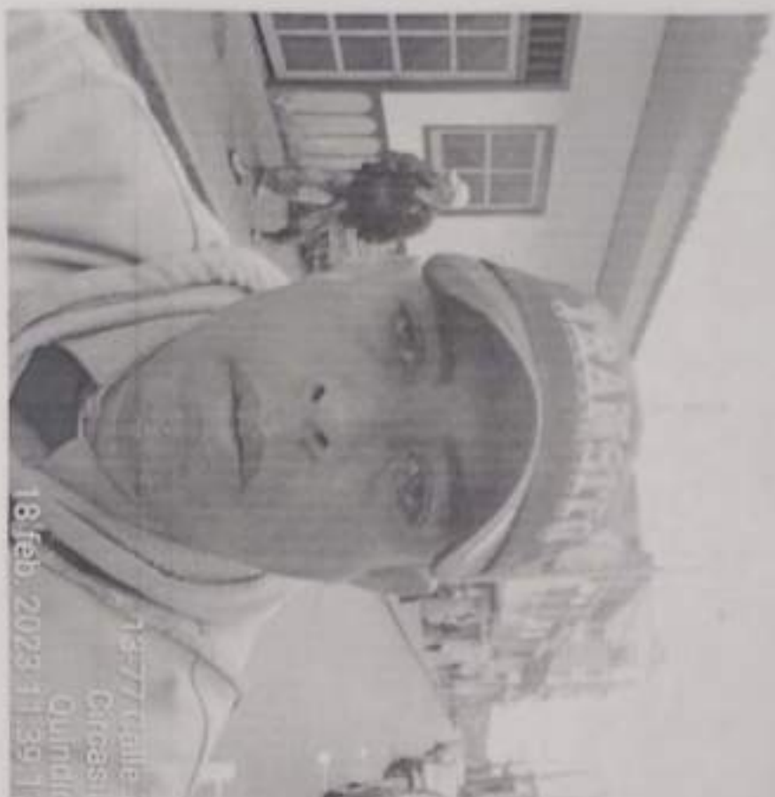
13-777 Calle Circos Quindío 18 feb. 2023 11:39