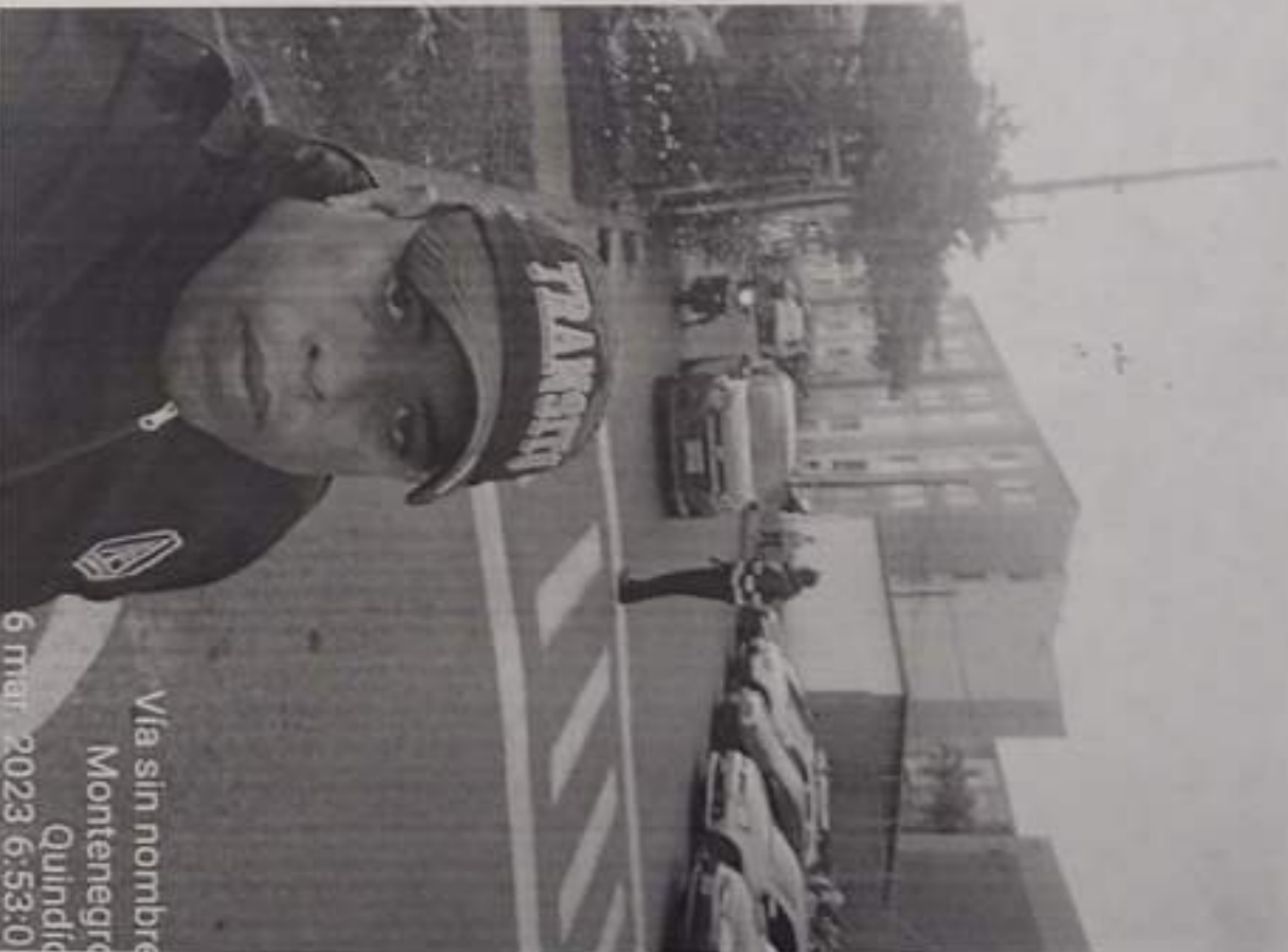
Via sin nombre Montenegro Quindío 6 mar. 2023 6:53:0