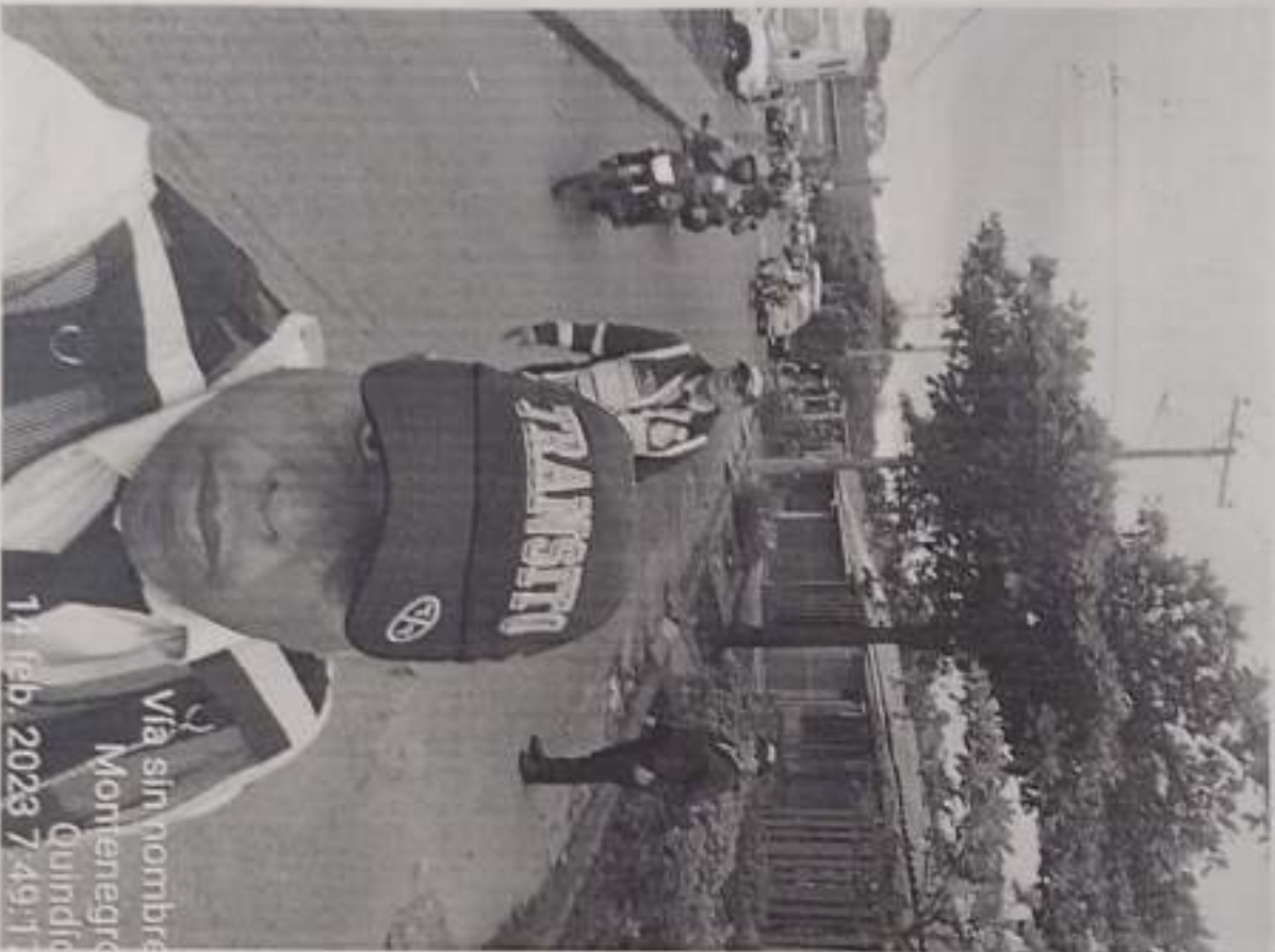
Via sin nombre Montenegro Quindío 14 feb. 2023 7:49:17