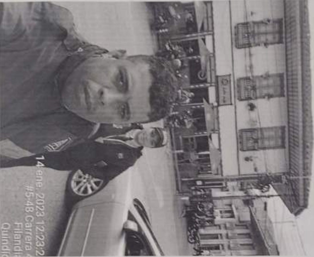
14 ene. 2023 12:23:2 #5-48 Carrera Filandis Quindío