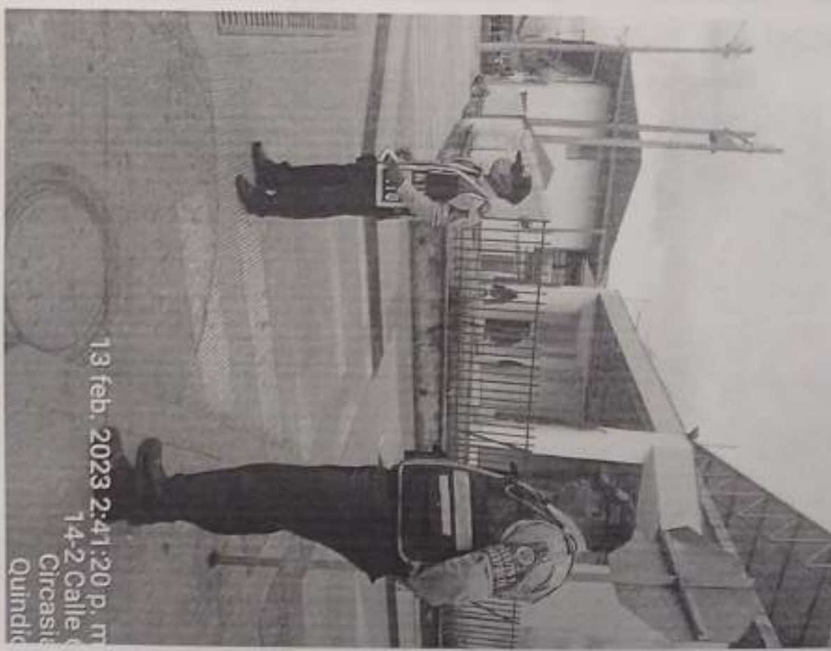
13 feb. 2023 2:41:20 p. m. 14-2 Calle Circasita Quindío