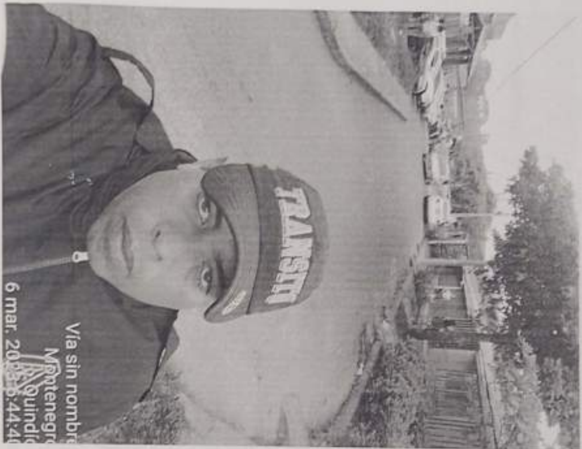
Via sin nombre Montenegro Quindío 6 mar. 2023 5:44:41