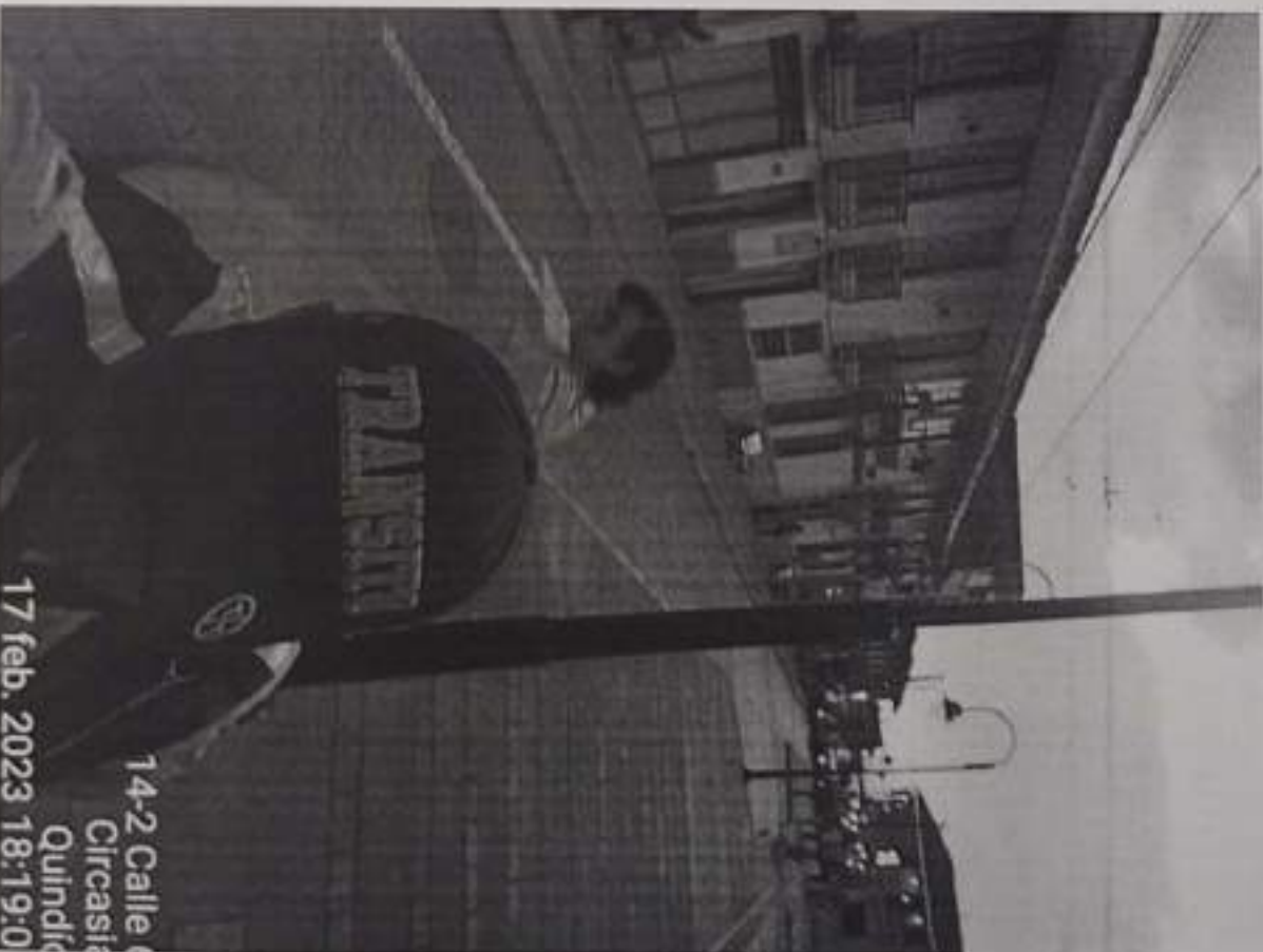
14-2 Calle Circasía Quindío 17 feb. 2023 18:19:00